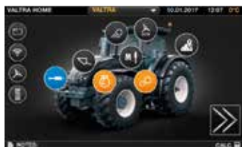
Facile da navigare all'interno del menù.

Valtra SmartTouch ha elevato l'uso del trattore ad un livello superiore. È più intuitivo del tuo SmartPhone ed è disponibile nei trattori della serie N, T e S (135 - 405 HP). Le impostazioni sono facilmente accessibili con due soli tocchi o scorrendo il dito sul monitor. Tutta la tecnologia è integrata nel nuovo formato e facile da usare: Autoguidare, ISOBUS, Telemetria, AgControl e TaskDoc. La funzione SmartTouch è di serie sui modelli Versu e Direct.