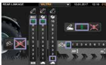
Lo schermo a sfioramento da 9", gli ampi comandi, le impostazioni e le funzioni sono di semplice utilizzo.