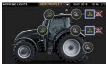
La configurazione delle luci di lavoro risulta semplice grazie allo schermo a sfioramento da 9". Nel bracciolo ci sono anche pulsanti on/off per le luci e i fari di lavoro.