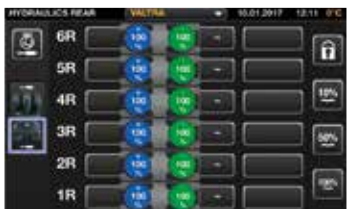
È possibile assegnare qualsiasi comando per azionare le funzioni idrauliche, comprese le valvole idrauliche anteriori e posteriori, i sollevatori anteriori e posteriori e il caricatore frontale.