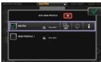
I profili degli operatori ed impostazioni possono essere facilmente modificati da qualsiasi menu sullo schermo. Tutte le modifiche alle impostazioni verranno salvate automaticamente nel profilo selezionato.