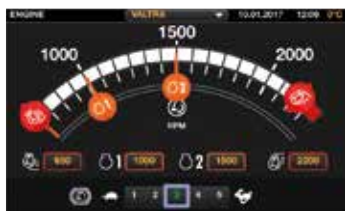
Configurazione logica delle impostazioni, con un solo tocco o scorrendo il dito sul monitor. Tutte le impostazioni sono automaticamente salvate.